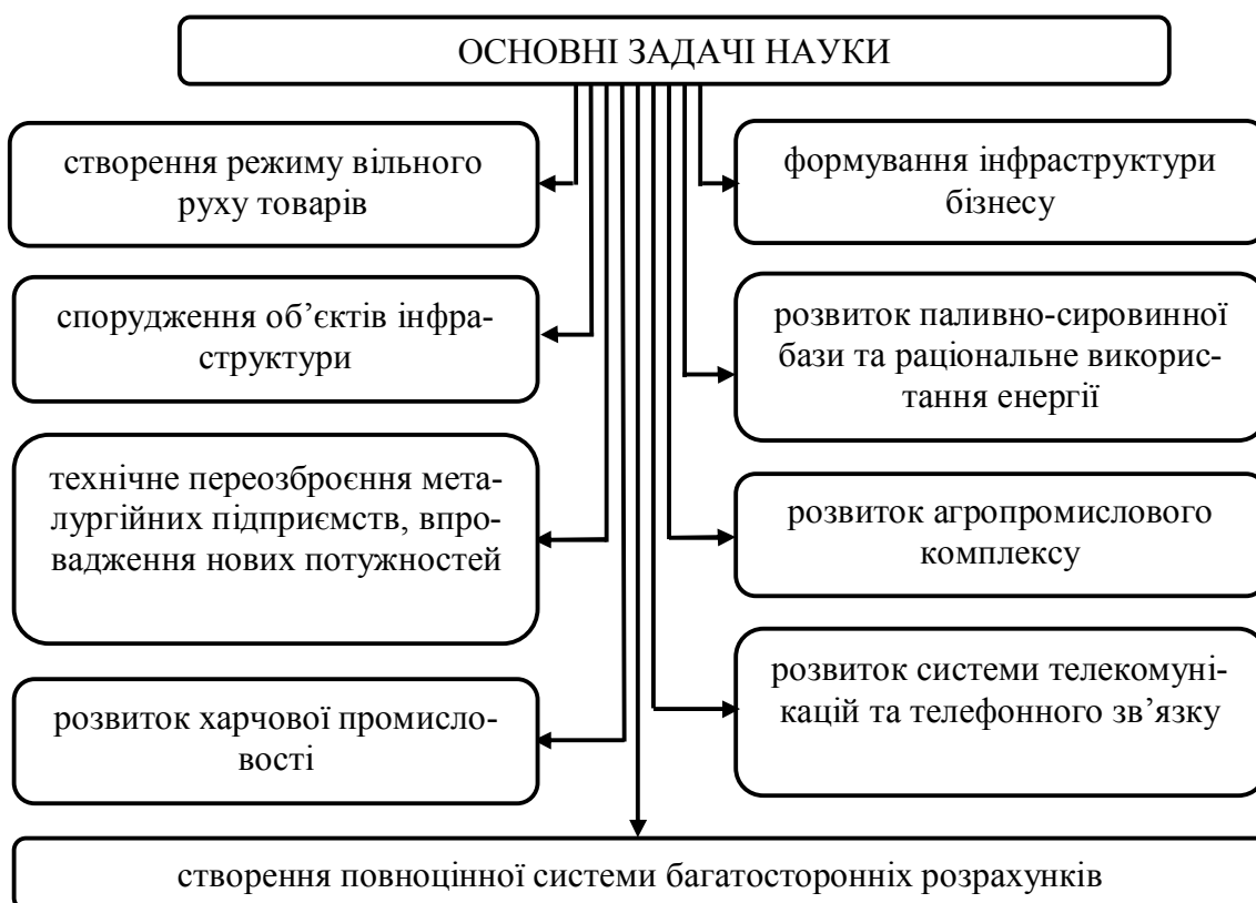
Рисунок 1 – Основні задачі науки

логій виробництва, впливає на конкурентоздатність. Основні її задачі та функції наведені на рис.1 та 2.