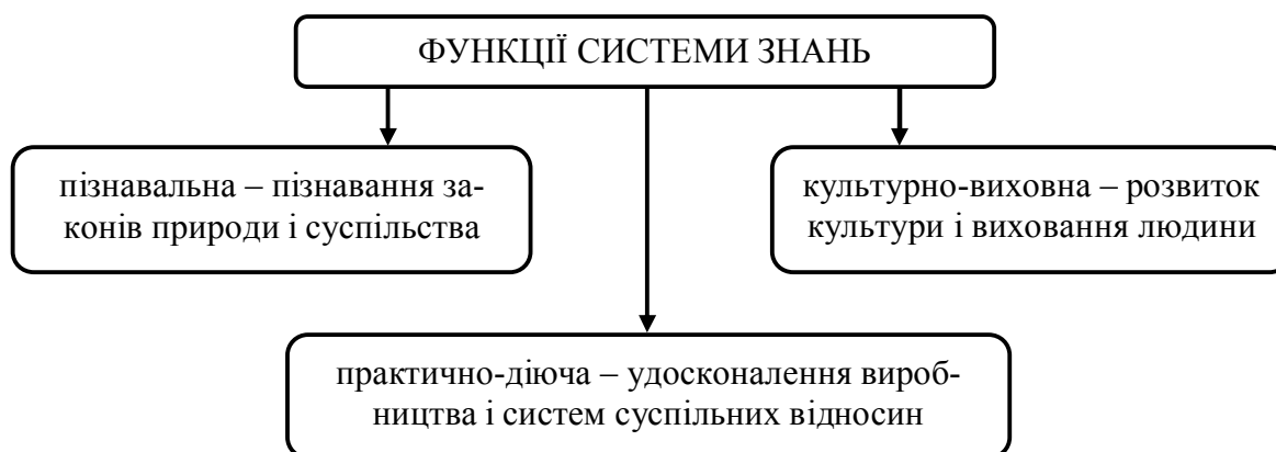
Рисунок 2 – Основні функції науки

Під науковими дослідженнями необхідно розуміти процес вивчення певного об'єкта з метою встановлення закономірностей його виникнення, розвитку і втілення у практичну діяльність в інтересах людини. Основні етапи дослідження наведені на рис.3.