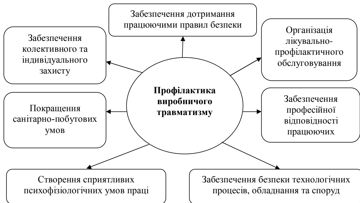
Рисунок 2 – Основні заходи профілактики виробничого травматизму на підприємствах України (розроблено авторами)

нювальна робота, навчання всіх працівників підприємства безпечних методів роботи дозволяють багаторазово знизити рівень травматизму на підприємстві.